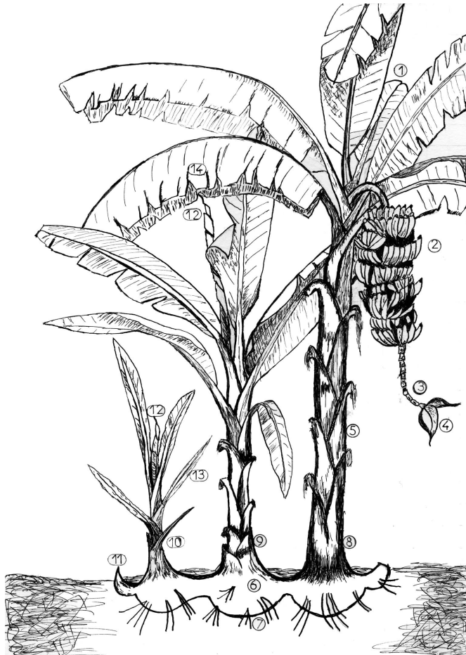
1 Bractée florale, 2 Régime avec mains de fleurs femelles (bananes), 3 Rachis de l'inflorescence (fleurs hermaphrodites tombées), 4 Bourgeon terminal (mâle), 5 Pseudo-tronc (gainnes foliaires imbriquées), 6 Souche (ou bulbe, vraie tige), 7 Racines, 8 Pied-mère (porteur du régime), 9 Rejet fils, 10 Rejet petit-fils, 11 Œilleton de la quatrième génération, 12 Cigare foliaire, 13 Feuille lancéolée, 14 Feuille large, adulte.

La partie supérieure de la gaine se modifie en un pétiole robuste prolongé par une nervure centrale. De part et d'autre de celle-ci s'étendent les deux parties presque symétriques du limbe, l'ensemble ayant une forme ovale et allongée, de grandes dimensions. Chaque nouvelle feuille sort au sommet du faux-tronc et se déroule ensuite.