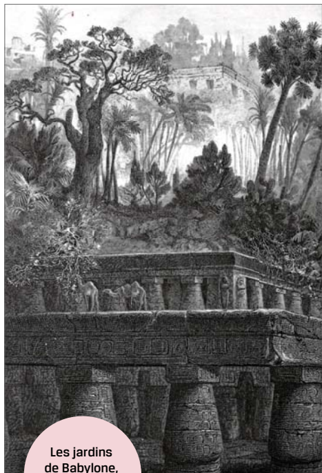
Les jardins de Babylone, gravure d'Arthur Mangin, 1867.

soutenues par des piliers en brique. L'eau puisée dans l'Euphrate était montée par un système ingénieux, qui sera ultérieurement appelé vis d'Archimède. De loin, dans cette région sans relief, la végétation semblait sortir de nulle part, en suspens au-dessus du sol. Certains textes décrivent la première terrasse plantée de grands arbres comme des platanes, palmiers-dattiers, pins, cèdres ; la deuxième, plus haute, recevait quelques genévriers mais surtout de nombreux arbres fruitiers. Enfin, la terrasse supérieure était essentiellement réservée aux fleurs, avec des anémones, tulipes, lis, iris et une collection de rosiers.