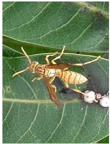
Guêpes (p. 120)