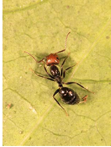
Fourmis (p. 117)