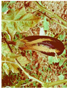
Thrips phytophages (p. 56)