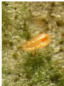
Punaises prédatrices (p. 96)