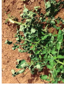
Aleurodes (p. 34)