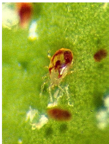
Acariens prédateurs (p. 92)