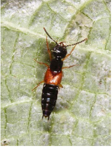
Staphylin (p. 113)