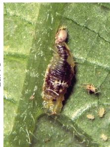
Syrphes (p. 103)