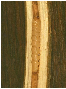
Coléoptères (p. 72)