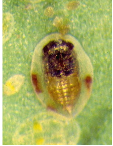
Parasitoïdes (p. 122)