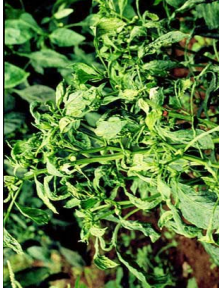
Acariens phytophages (p. 30)