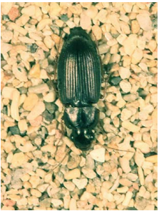
Carabes (p. 113)