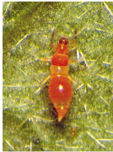
Thrips prédateurs (p. 115)