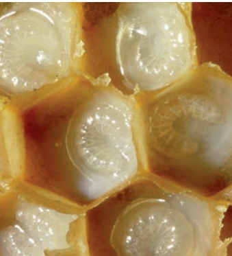
Larve d'abeille baignant dans la gelée royale.