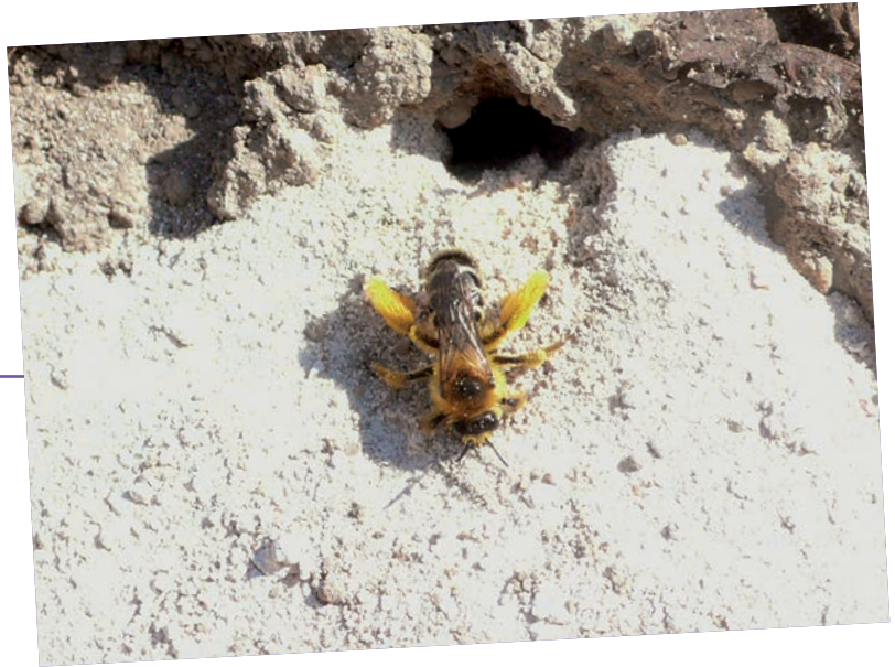
Une abeille à culotte ( Dasygaster hirtipes ) devant son terrier.

Cette longue histoire de plusieurs dizaines de millions d'années se reflète dans le nombre des espèces apparues au cours du temps. L'ancêtre commun qui vivait au moment de l'apparition des fleurs a donné naissance à environ 20 000 espèces différentes, nombre approximatif des espèces d'abeilles du monde entier.