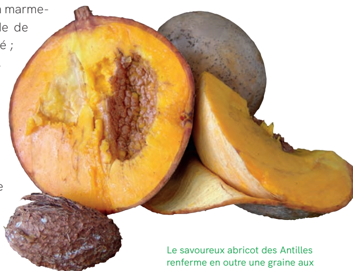
Le savoureux abricot des Antilles renferme en outre une graine aux propriétés insecticides.