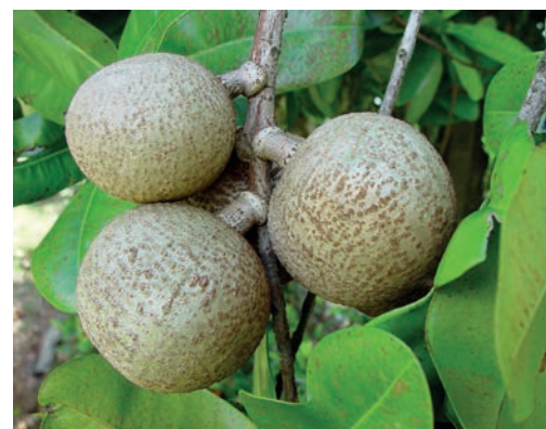
Abricotier des Antilles et sa fleur hermaphrodite, ingrédient principal de la rafraîchissante « eau des Créoles ».