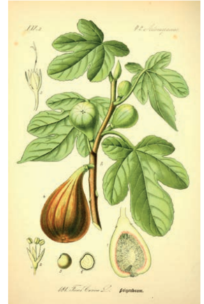
Le figuier est l'un des plus anciens arbres domestiqués.