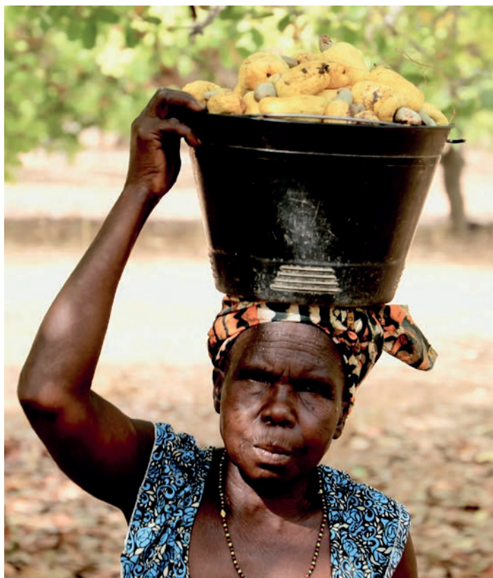
Ces noix de cajou fraîchement cueillies que porte cette Ivoirienne devront encore être décortiquées pour donner le produit que nous connaissons.

Quelles solutions pour se sortir de ce cycle infernal ? Les principes de l'agro-écologie peuvent apporter des réponses. Cette approche combine agronomie et écologie, agriculture et écosystème. Elle repose sur un principe-clé : l'utilisation des processus naturels, souvent associés à la biodiversité, pour assurer des services écologiques au bénéfice de la production agricole. Ces systèmes de production complexes et diversifiés visent ainsi la substitution des intrants chimiques (pesticides mais aussi engrais) par ces services écologiques. La transition totale des systèmes intensifs vers des systèmes agroécologiques est