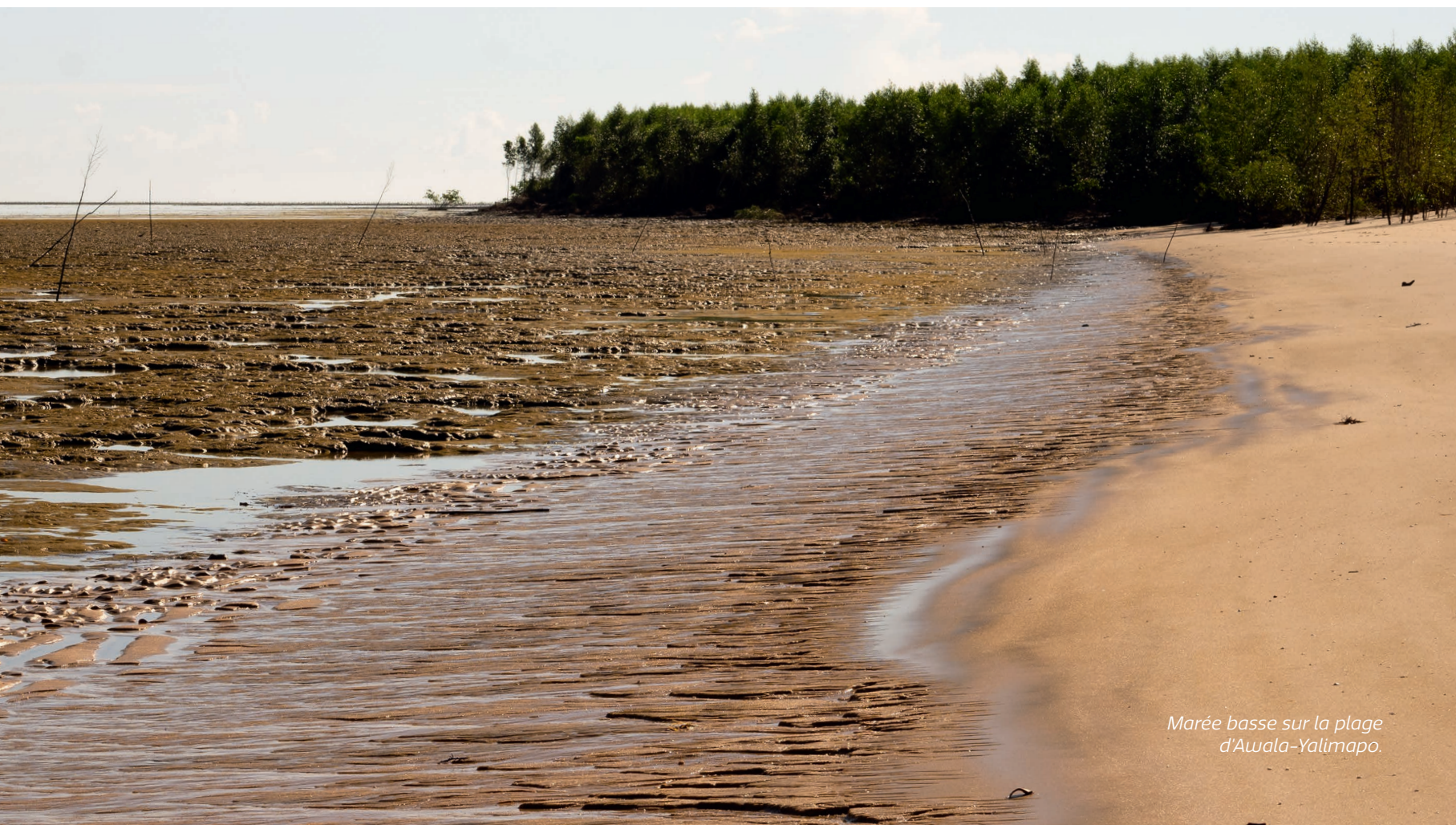
Marée basse sur la plage d'Awala-Yalimapo.

Et bien sûr, nous tenons à remercier très chaleureusement tous les habitants du bas-Maroni et du bas-Oyapock qui nous ont toujours accueillis avec bienveillance et partagé avec nous leurs précieuses connaissances de ce territoire.