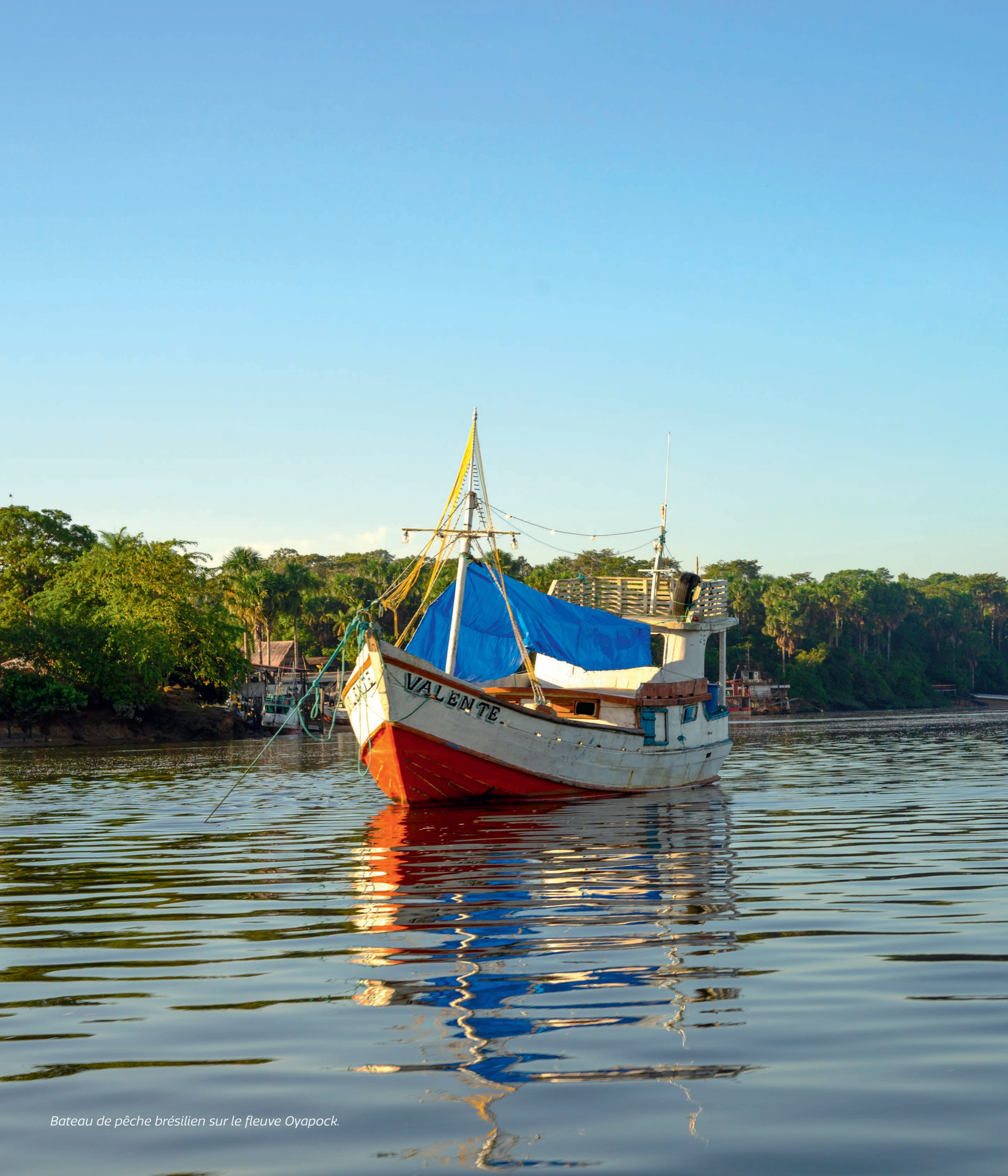
Bateau de pêche brésilien sur le fleuve Oyapock.