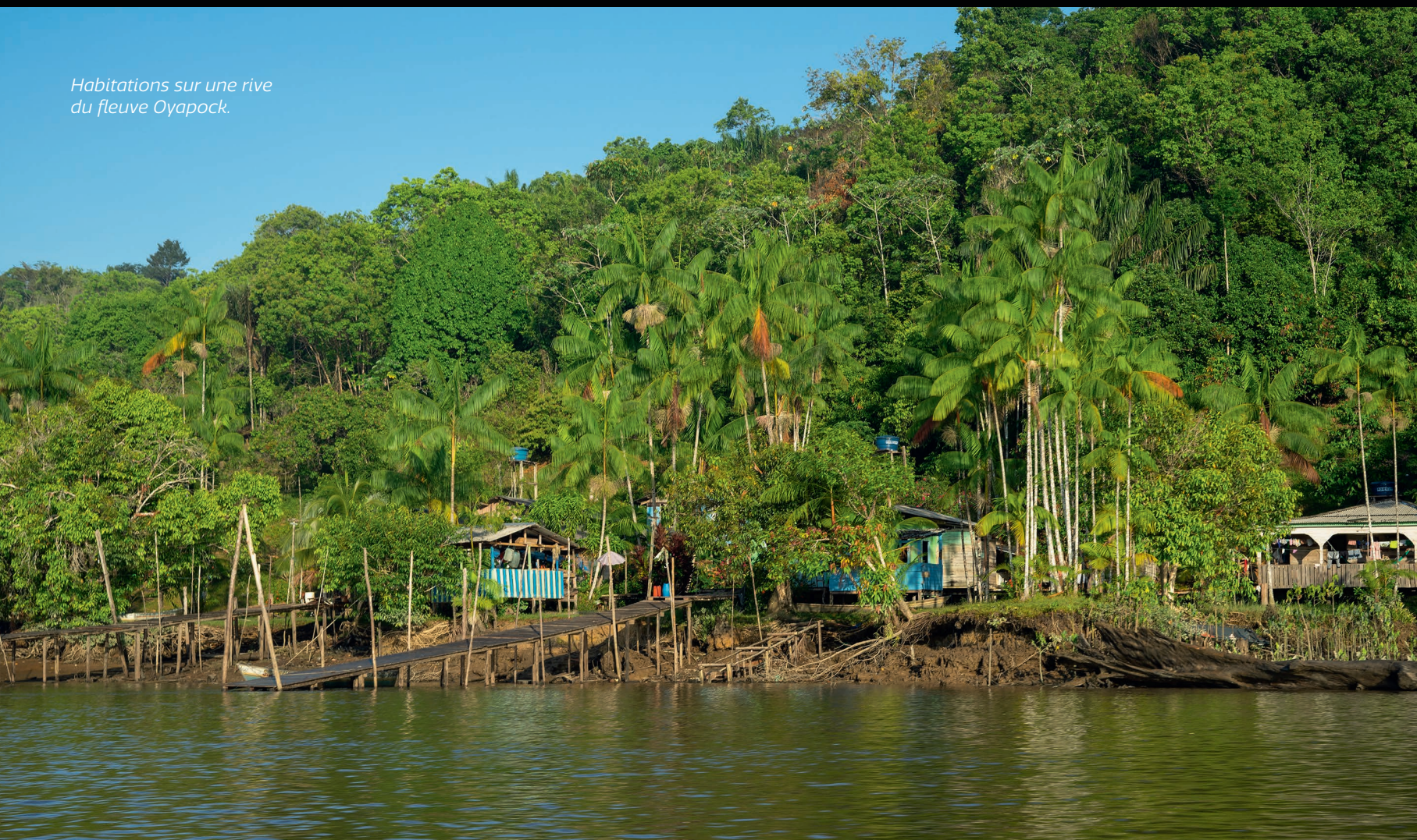
Habitations sur une rive du fleuve Oyapock.