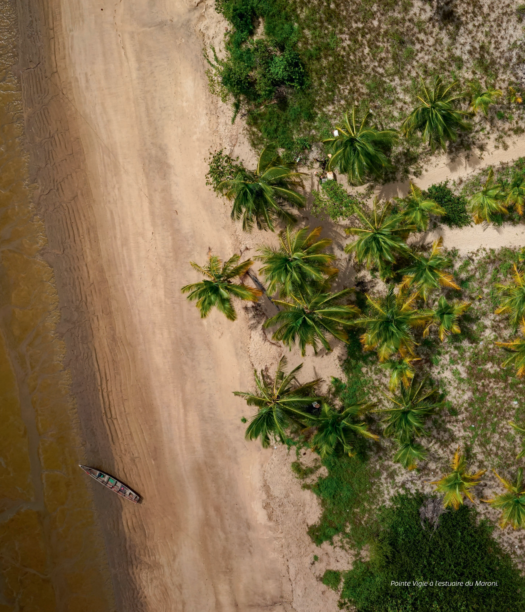
Pointe Vigie à l'estuaire du Maroni.