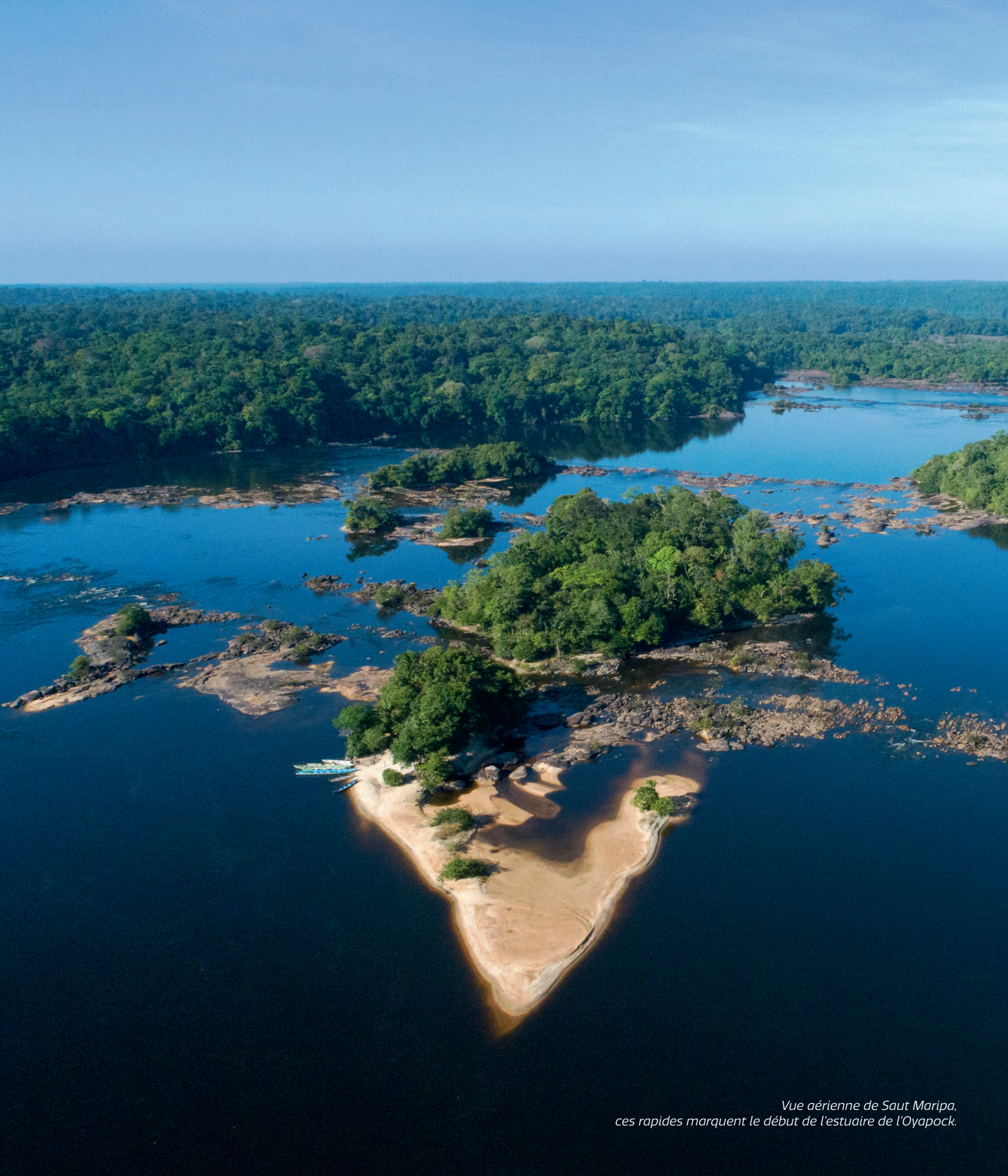
Vue aérienne de Saut Maripa, ces rapides marquent le début de l'estuaire de l'Oyapock.