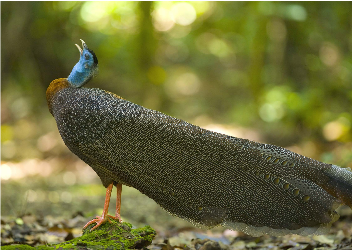
Argus géant mâle criant pour appeler les femelles.