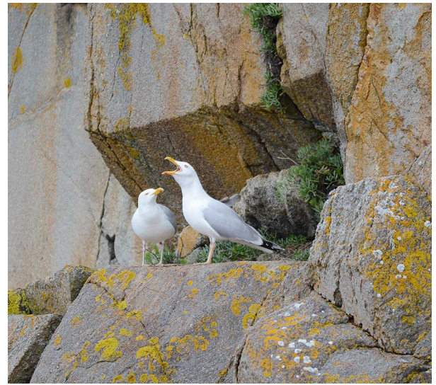
Couple de goélands occupant son site de nidification.

Un phénomène semblable s'observe chez les goélands, qui crient plus qu'ils ne chantent. Le goéland argenté ( Larus argentatus ) produit quatre vocalisations distinctes : des trompettements, des miaulements, et deux sortes de cris. Seules les deux premières interviennent au moment de la reproduction. Elles ont divergé des vocalisations équivalentes des espèces voisines, beaucoup plus graves. Cette divergence, qui a rendu les vocalisations beaucoup moins attractives pour les femelles des autres espèces, a favorisé l'isolement reproducteur. Par contre, les cris sans signification sexuelle sont restés proches. Dans les forêts pluviales d'Asie du Sud-Est vit un grand faisan, l'argus géant ( Argusianus argus ). Comme tous les faisans, les mâles comptent sur leur plumage somptueux pour conquérir les femelles. Pour ce faire, ils aménagent une petite zone dégagée, une arène de parade, aussi éloignée que possible de celles de leurs concurrents. Mais comment se faire remarquer des femelles dans un milieu aussi fermé par la végétation luxuriante ? Par un appel qui porte loin, pour signaler l'emplacement où ils se trouvent.