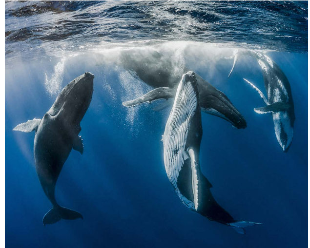
Trois mâles de rorqual ou baleine à bosse ( Megaptera novaeangliae ), à gauche, paradent autour d'une femelle, à droite, attirée par leurs chants.

Il n'est pas nécessaire de posséder un organe émetteur de sons pour communiquer acoustiquement. Chez la grande vrillette ( Xestobium rufovillosum ), un coléoptère discret assez fréquent près de l'homme, la femelle utilise la moindre anfruosité d'une poutre ou d'un meuble pour pondre. Les jeunes larves s'enfoncent petit à petit dans une galerie qu'elles creusent en se nourrissant du bois, provoquant la vermoulure des charpentes et des meubles. Elles se transforment en adultes au printemps. Pour se signaler aux femelles des environs, les mâles cognent à intervalles réguliers leur tête au front aplati contre la paroi de leur galerie. Ce bruit caractéristique, audible dans le silence de la nuit alors que les responsables restent invisibles, a autrefois été entouré de superstitions. Selon la plus courante, une mort prochaine s'annonçait dans le foyer. Cette croyance, associée au rythme régulier des tapements, a valu à l'insecte son nom populaire d'« horloge de la mort », alors qu'il s'agit en fait d'une horloge de la vie.