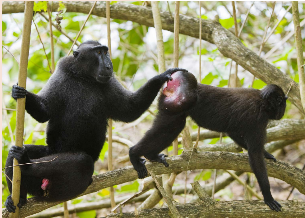
La femelle de macaque nègre ( Macaca nigra ) se contente de montrer ses fesses rouges au mâle pour l'informer de sa disponibilité à l'accouplement.

Chez la plupart des mammifères, l'ovulation des femelles est précédée et accompagnée d'un ensemble de phénomènes physiologiques et comportementaux appelé œstrus (un mot latin d'origine grecque signifiant « fureur »). Dans le langage courant, et surtout pour les animaux domestiques, une femelle en œstrus est dite « en chaleur ».