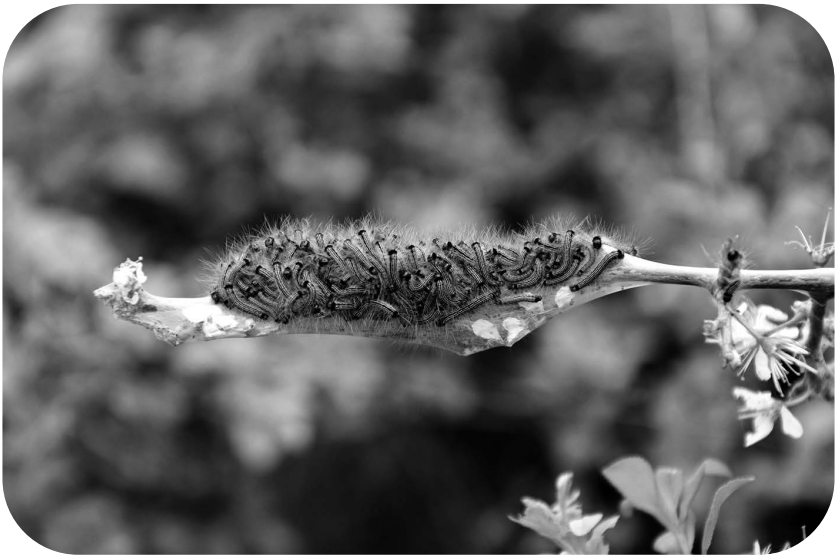
Chenilles grégaires de Malacosoma neustria (Lépidoptères) vivant dans un nid de soie tissé.