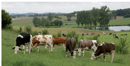
Troupeau laitier de races variées, dont la Holstein.

Le premier règlement européen à reconnaître officiellement ce mode de production apparaît en 1991. Deux textes européens viennent réglementer l'agriculture biologique à partir du 1 er janvier 2009 : les règlements CE de 2007 et 2008. Des modifications de ces règlements ont lieu régulièrement et la dernière version en date est le règlement européen